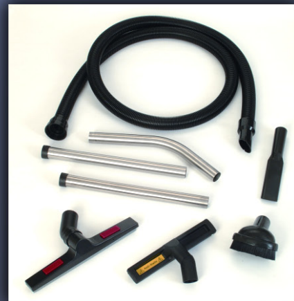
38 mm Zubehörsatz für Modelle KV 15 bis KV 45

Ritz Industriesauger GmbH Leitweg 3 50181 Bedburg