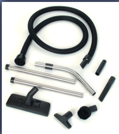
32 mm Zubehörsatz für KV 10